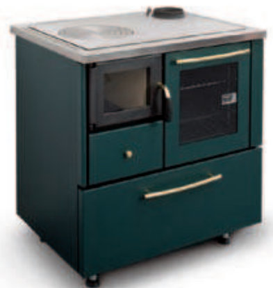
Esempio finitura standard: verde