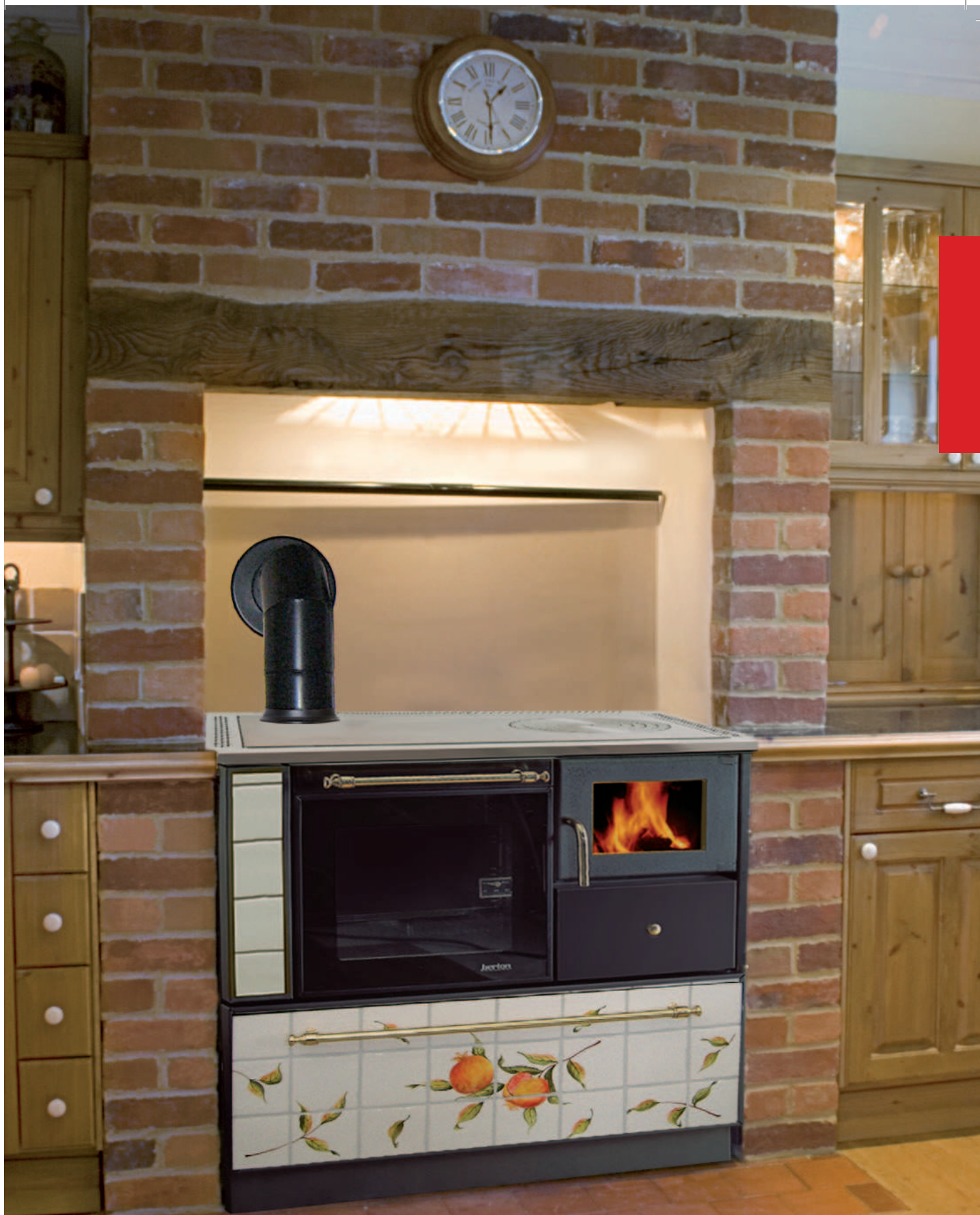
Esempio finitura con piastrelle, inserite in cornicetta nera (accessoriata con base d'appoggio su zoccolo nero).