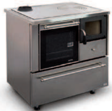
Esempio finitura standard: inox satinato